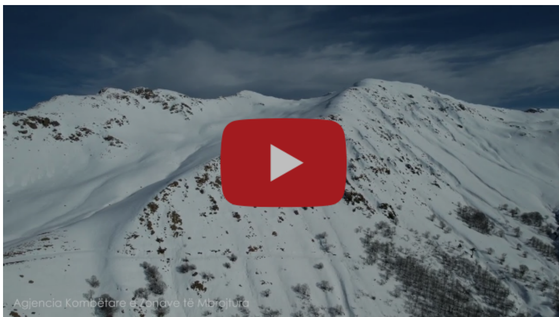
Malet e Parkut Kombëtar Shebenik