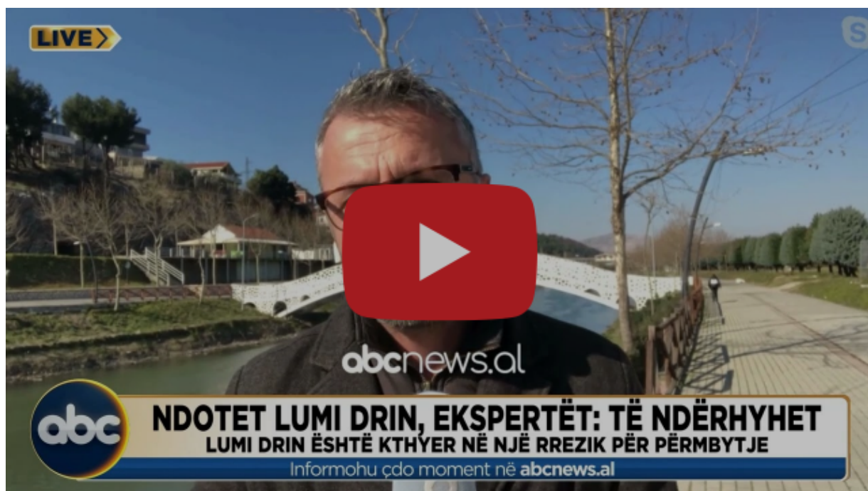
Ndotet lumi Drin, ekspertët: Të ndërhyet