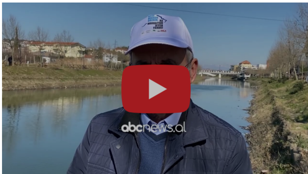
Ndotet lumi Drin, ekspertët bëjnë apel për ndërhyrje