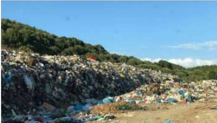
Vend-depozitimi Gur, Bashkia Divjakë

Vlerësohet se edhe për këtë sipërfaqe e cila është mbyllur tashmë dhe nuk shërben si vend-depozitim për mbetjet, është e nevojshme të ndërhyet me investime për rehabilitim, pasi mbetjet e depozituara prej vitesh dhe të mbuluara me dhe janë pikë e nxehtë mjedisore për dëmet që vazhdon të shkaktojë.